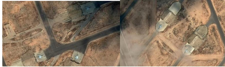
Sidi Barrani Üssü, Mısır. Birleşik Arap Emirlikleri'ne bağlı Mirage savaş uçakları, Mayıs 2020.